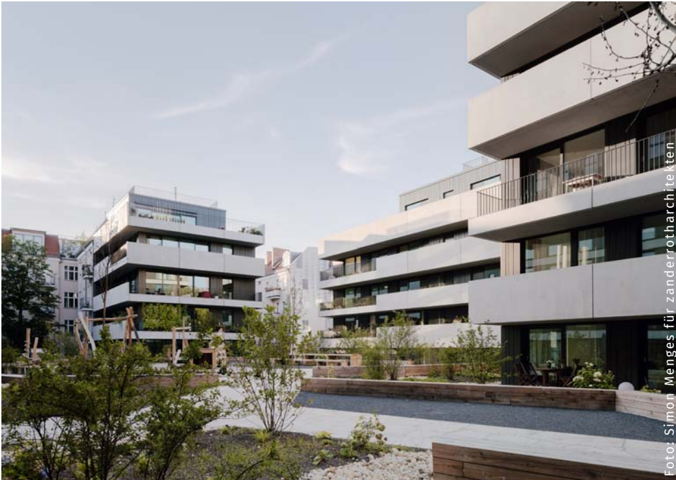
Realisiertes Projekt von SmartHoming und zanderrotharchitekten in der Pasteurstraße

SmartHoming verfügt über langjährige Erfahrung im Bereich der Umsetzung von Baugemeinschaftsprojekten. Die Projekte werden in enger Kooperation mit dem renommierten Büro zanderrotharchitekten entwickelt.