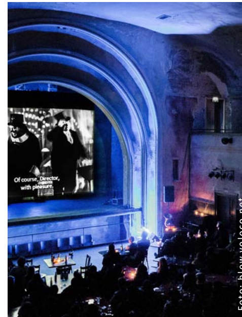
Das Stummfilmkino Delphi