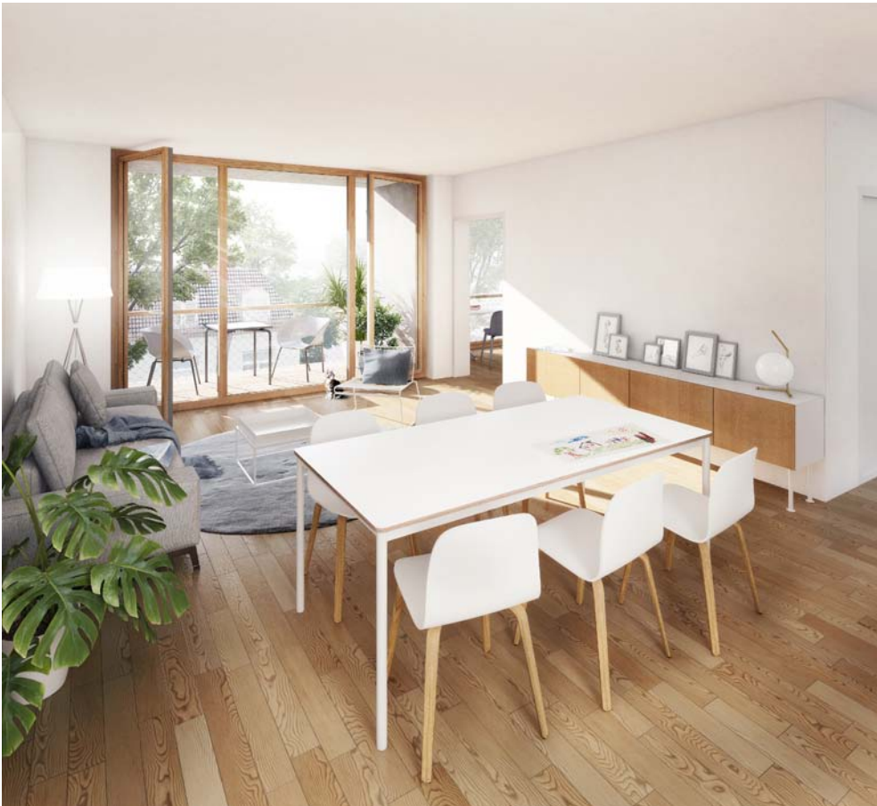
Visualisierung Innenraum 4-Zimmer-Wohnung

Alle Wohnungen verfügen über eine Loggia oder Terrasse, sowie eine gehobene Ausstattung mit Fußbodenheizung in allen Räumen. Im Kellergeschoss stehen Abstellräume, PKW- und Fahrradstellplätze zur Verfügung.