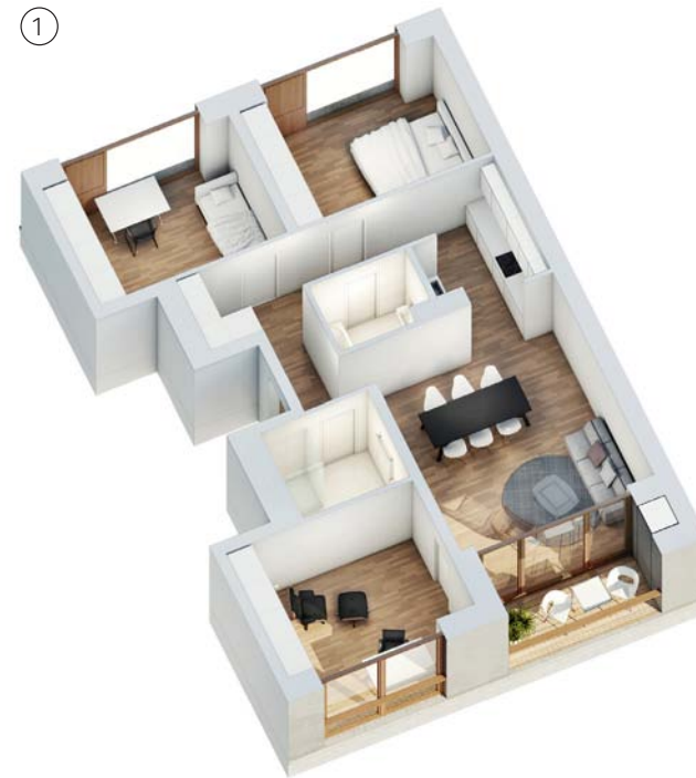
Haus 1 - Vorderhaus Regelgrundriss 4 Zimmer ca. 95 qm