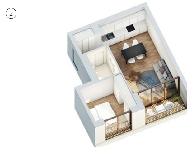
Haus 2 - Gartenhaus Regelgrundriss 2 Zimmer ca. 43 qm

Unverbindliche Darstellung der Wohnungstypen im Projekt „LANGHANS24“*