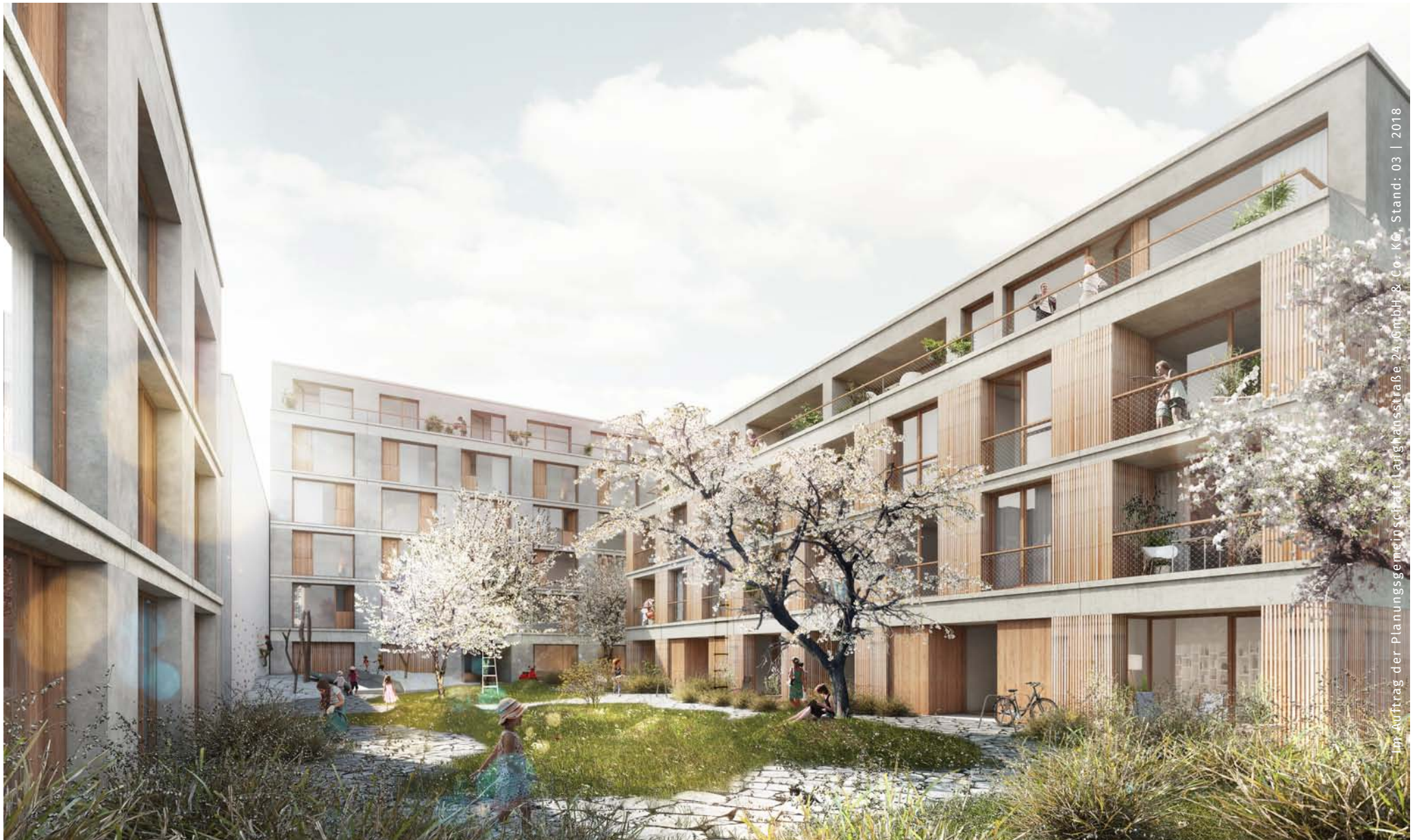
Baugemeinschaftsprojekt in Berlin-Weißensee