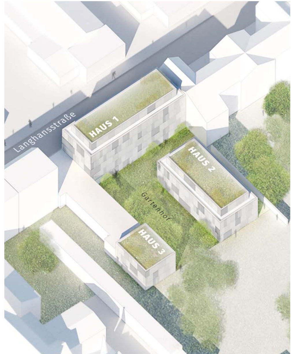
Vogelperspektive des Bauvorhabens Langhansstraße 24 in Weißensee, Planungsstand: 03|2018*

Es entstehen 47 Eigentumswohnungen und zwei Gewerbeeinheiten in drei Gebäuden zwischen drei und sechs Geschossen – ein entspannter Rückzugsort mit viel Sonne, Luft und Grün mitten in der Stadt!